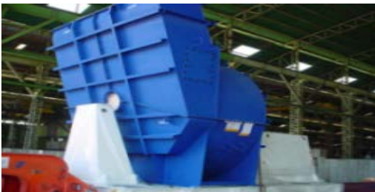
เสื้อพัดลม โรงผลิตไฟฟ้า