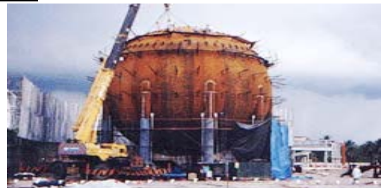
คลังเก็บก๊าซ อุตสาหกรรมพลังงาน