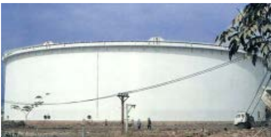
ถังเก็บน้ำมัน อุตสาหกรรมพลังงาน

นอกจากการรับจ้างผลิตภาชนะความดันแล้ว บริษัทฯสามารถรับจ้างผลิตภาชนะบรรจุสารเคมีทั่วไป ซึ่งภาชนะดังกล่าวไม่ได้ออกแบบเพื่อให้สามารถรับความดันในกระบวนการผลิต จึงสามารถรับความดันได้ในระดับหนึ่งเท่านั้น ซึ่งโดยทั่วไปจะใช้เป็นถังเก็บสารเคมี เช่น ถังเก็บน้ำมัน และถังเก็บเม็ดพลาสติก เป็นต้น