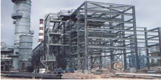
โครงสร้างเหล็กอาคารโรงงาน อุตสาหกรรมปิโตรเคมี