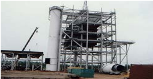
ปล่องควันไอเสียโรงงาน อุตสาหกรรมกระดาษ