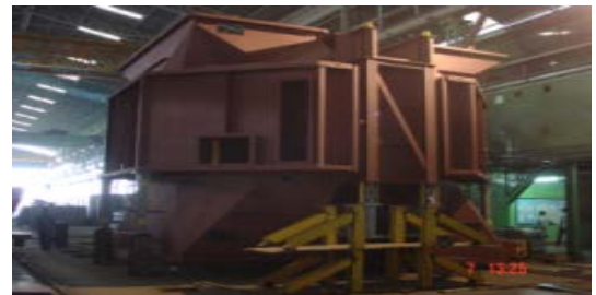
ชิ้นส่วนเครื่องปรับอุณหภูมิอากาศ โรงผลิตไฟฟ้า