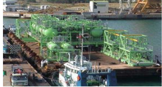
การติดตั้งเครื่องจักร อุปกรณ์และโครงสร้างเหล็ก อุตสาหกรรมกลั่นน้ำมัน