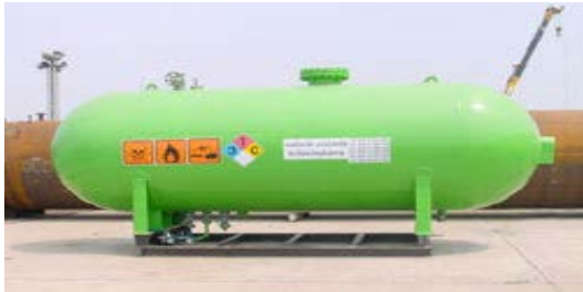
ถังเก็บแอมโมเนีย อุตสาหกรรมผลิตถุงมือยาง