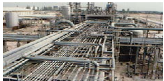
การติดตั้งระบบท่อ อุตสาหกรรมปิโตรเคมี