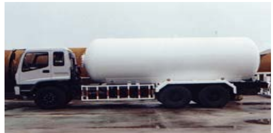
ถังเก็บก๊าซปิโตรเลียมเหลว