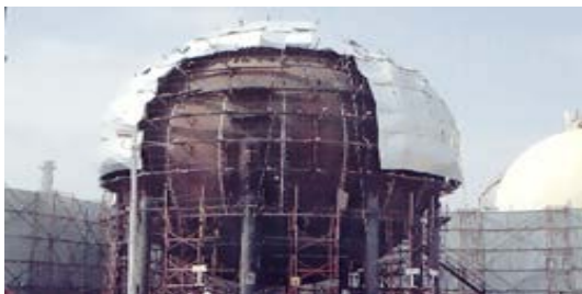
ถังเก็บก๊าซปิโตรเลียมเหลวทรงกลม อุตสาหกรรมพลังงาน