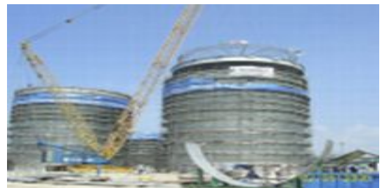
ถังเก็บสารเคมี อุตสาหกรรมปิโตรเคมี