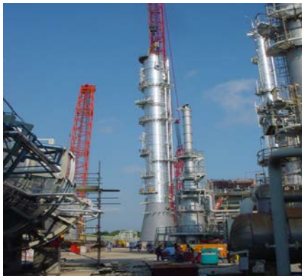
หอกลิ้น อุตสาหกรรมปิโตรเคมี