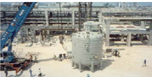
การติดตั้งเตาปฏิกรณ์ อุตสาหกรรมปิโตรเคมี

บริษัทฯให้บริการติดตั้งเครื่องจักรและอุปกรณ์ในกระบวนการผลิตของโรงงานอุตสาหกรรมซึ่งเป็นการติดตั้งทั้งเครื่องจักรและอุปกรณ์ที่บริษัทฯเป็นผู้ผลิตและการรับจ้างเฉพาะการติดตั้ง เช่น การติดตั้งเตาปฏิกรณ์ (Reactor) และการติดตั้งระบบท่อในโรงงานปิโตรเคมีเพื่อเป็นช่องทางในการส่งผ่านสารเคมีในกระบวนการผลิต การติดตั้งเครื่องจักร อุปกรณ์และโครงสร้างเหล็กในพื้นที่บริเวณท่าเรือ เป็นต้น