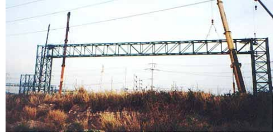
โครงสร้างเหล็กรับท่อ นิคมอุตสาหกรรมมาบตาพุด