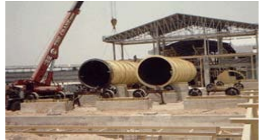
ชิ้นส่วนเตาเผา อุตสาหกรรมพลังงาน