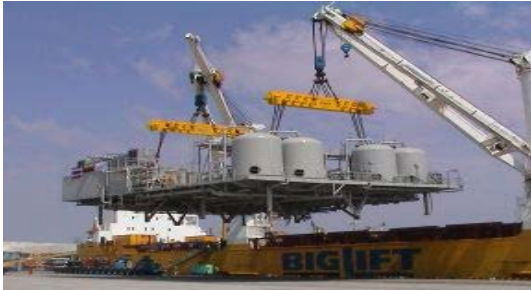
การติดตั้งเครื่องจักร อุปกรณ์และโครงสร้างเหล็ก อุตสาหกรรมกลั่นน้ำมัน