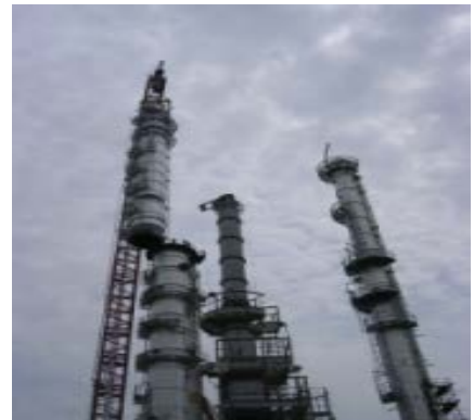
หอกลิ้น อุตสาหกรรมปิโตรเคมี